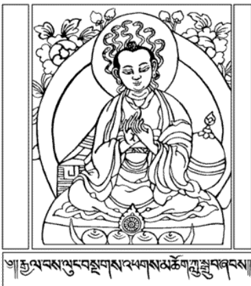
Picture: https://en.wikipedia.org/wiki/File:Nagarjuna.gif 'Nāgārjuna [public domain work of art]

"The ontological paradox, on the other hand - which we hereby name "Nāgārjuna's Paradox"- although, as we have seen, is intimately connected with a paradox of expressibility, is quite distinctive, and to our knowledge is found nowhere else. If Nāgārjuna is correct in his critique of essence, and if it thus turns out that all things lack fundamental natures, it turns out that they all have the same nature, that is, emptiness, and hence both have and lack that very nature. This is a direct consequence of the purely negative character of the property of emptiness, a property Nāgārjuna first fully characterizes, and the centrality of which to philosophy he first demonstrates." (Garfield & Priest 2003: 18 -19)